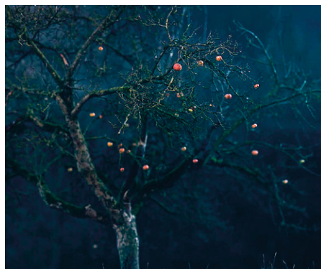
Edition Nr. 3/2020