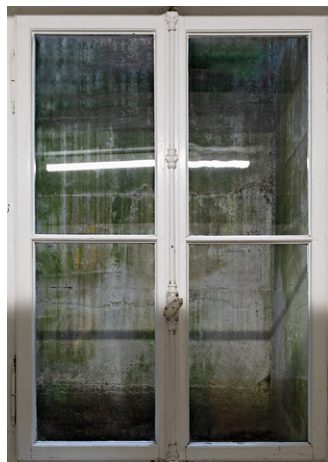
Edition Nr. 4/2021