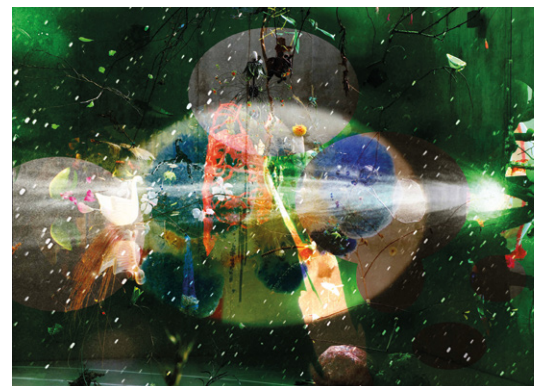
Edition Nr. 1/2018