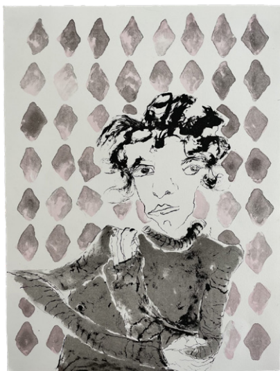
Edition Nr. 5/2022